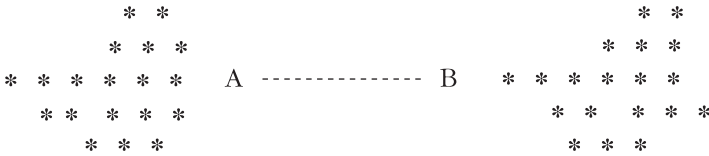
Figura 2. Segunda configuración: uno de los dos cónyuges pertenece a un sistema cohesivo y el otro a un sistema dispersivo (SC + SD).