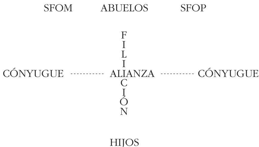
Figura 4. Intersección de los ejes de alianza y de filiación. Punto nodal del sistema Trigeneracional.

Como decíamos antes el vínculo de alianza es inversamente proporcional al vínculo de filiación. Es por eso que la pareja, al establecer este vínculo de alianza, va marcando una mayor distancia con ambas familias de origen y después con los propios hijos. Esto es aquello que señala la diferenciación intergeneracional , que, como todos sabemos, cuando se perturba provoca aquellos síntomas disfuncionales por los cuales nos han consultado.