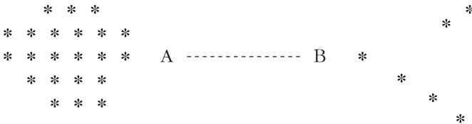
Figura 3. Tercera configuración: ambos cónyuges pertenecen a sistemas dispersivos (SD + SD).